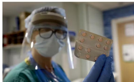
Une infirmière prépare les médicaments d'un patient participant à l'essai clinique TACTIC-19, à l'hôpital d'Addenbrooke à Cambridge, en Angleterre, le 21 mai 2020.